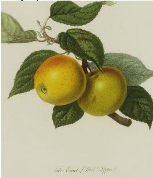
Pomona Londinensis 1818 William HOOKER.

ORIGINE : "Introd 1790 by Wood of Huntingdon" (The Book of Apples, p.197, 1993, Brogdale ou elle set protégée). D' après l'anglais Lindley, ce serait un semis de Golden Pippin (ne pas confondre avec Golden Delicious), fait dans le comté de Somerset à Court de Wick. D'après Leroy la première citation officielle date de 1819.